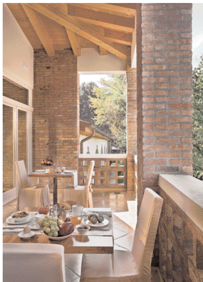
La reception e la terrazza del primo piano, utilizzata per colazioni, cocktail e ricevimenti. Nella pagina accanto, il corpo centrale della struttura che ospita gli spazi comuni

“Dall'idea di creare un ambiente a misura d'uomo, nel quale io per primo avrei amato rifugiarmi tra un appuntamento d'affari e l'altro, con un habitat naturale attorno che è raro trovare in un territorio densamente abitato e trafficato come la pianura veneta, con il solo rumore dei volatili per compagnia e il fitto schermo ombroso degli alberi tutto attorno, con camere comode e luminose, attrezzate con un grande televisore che riceve centinaia di canali e nello stesso tempo può trasformarsi in computer, con un bagno ampio e luminoso dove farsi la doccia o mettersi a 'mollo' nella vasca diventano momenti di autentico relax. Un luogo immerso nella natura dove poter praticare gli sport preferiti piuttosto che mettersi all'ombra degli alberi o davanti al caminetto acceso d'inverno per godersi la lettura di un libro o sorseggiare una tazza di tè o il liquore preferito.