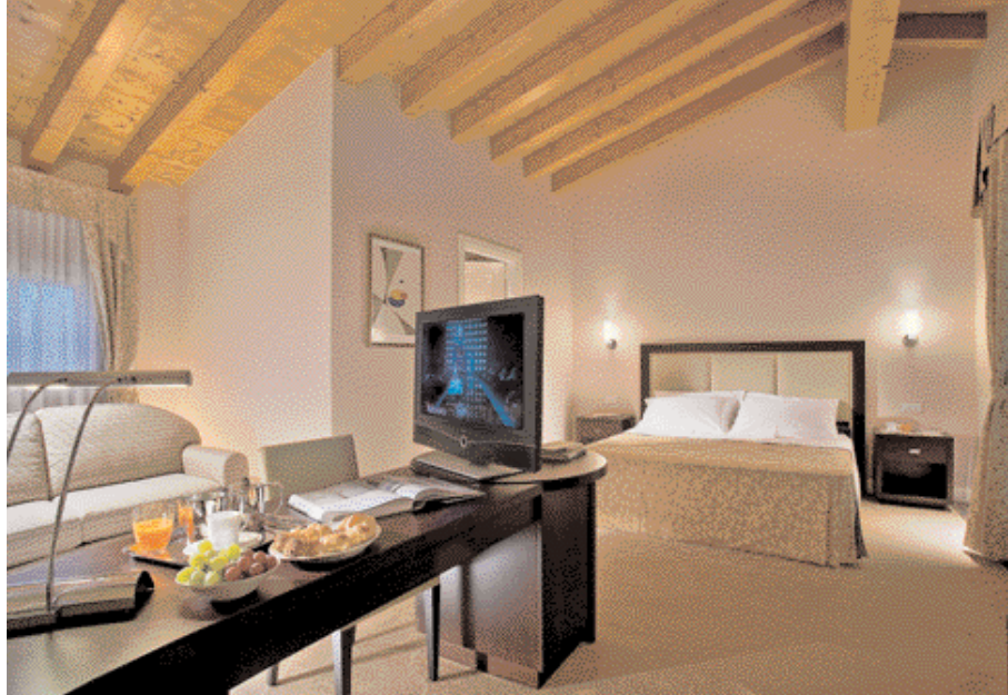
Le camere dispongono di grandi Tv a cristalli liquidi di ultima generazione che il cliente può collegare al proprio laptop. Le junior suite comprendono una zona con vasca idromassaggio a due posti rivestita in granito nero